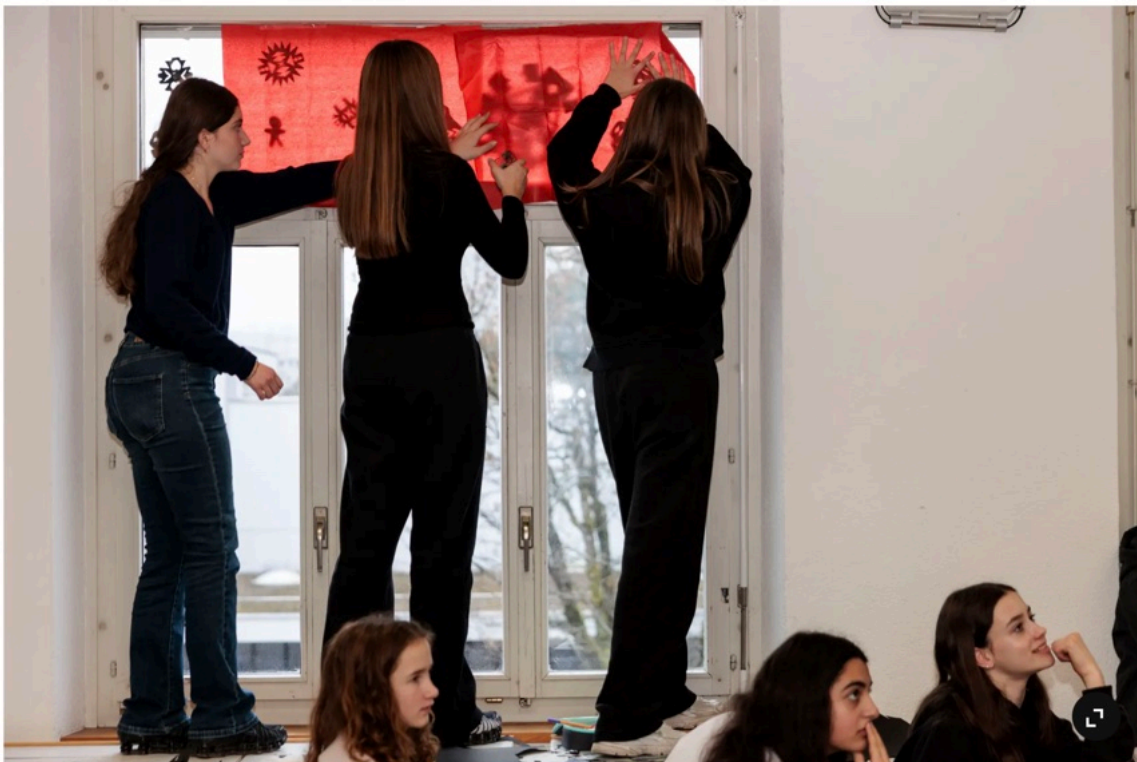
Die Schülerinnen der Klasse 7C verpassen dem Unterrichtsraum ein feierliches Gewand.

«Womit wollt ihr die Fenster dekorieren?», fragt Klassenlehrerin Mélanie Gerber. Die Schülerinnen und Schüler zählen auf: Kerzen, Geschenke, Wellen, Schneeballschlacht. Die Lehrerin notiert auf dem Laptop, projiziert die Wörter an die Wand. Ob das so für alle passe, fragt Gerber. Einem Mädchen widerstrebt die Schneeballschlacht. «Ich mag es nicht, wenn man sich gegenseitig abschießt.»